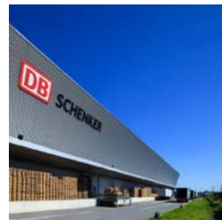
Gennevilliers Logistics Centre