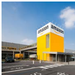
Lille-Douai Logistics Centre