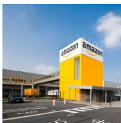
Lille-Douai Logistics Centre