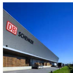
Gennevilliers Logistics Centre