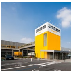
Lille-Douai Logistics Centre